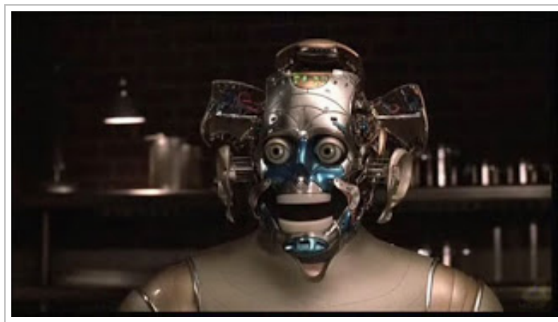
Den nye formen for ansiktsløftning har blitt uhyre populær i Hollywood, men noen tar det litt for langt...